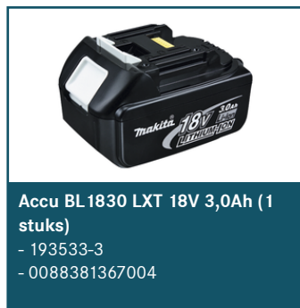
Accu BL1830 LXT 18V 3,0Ah (1 stuks) - 193533-3 - 0088381367004