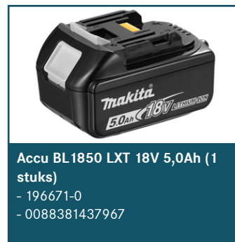
Accu BL1850 LXT 18V 5,0Ah (1 stuks) - 196671-0 - 0088381437967