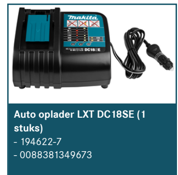
Auto oplader LXT DC18-E (1 stuks) - 194622-7 - 0088381349673

Dit is slechts een kleine greep uit het ruime assortiment. Kijk voor alle accessoires/verbruiksartikelen in de Catalogus of op www.makita.nl .