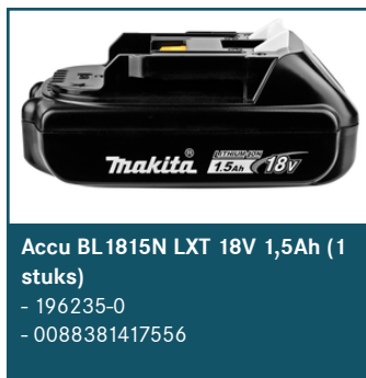
Accu BL1815N LXT 18V 1,5Ah (1 stuks) - 196235-0 - 0088381417556