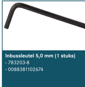
Inbussleutel 5,0 mm (1 stuks) - 783203-8 - 0088381102674