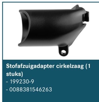
Stofafzuigadapter cirkelzaag (1 stuks) - 199230-9 - 0088381546263