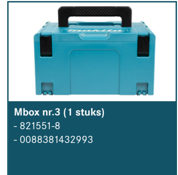
Mbox nr.3 (1 stuks) - 821551-8 - 0088381432993