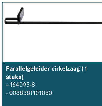
Parallelgeleider cirkelzaag (1 stuks) - 164095-8 - 0088381101080